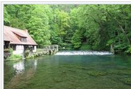
Abfluss des Blautopfs (2015), am linken Bildrand ist das historische Hammerwerk zu sehen

1. Tag: Fahrt von Ingelheim nach Blaubeuren. Nach Weck, Worscht und Piccolo ist eine leichte Wanderung um den Blautopf (ca. 2 Stunden) vorgesehen. Alternativ ist eine Klosterbesichtigung, ein Stadtrundgang oder ein Museumsbesuch möglich. Weiterfahrt nach Bad Urach ins Hotel.