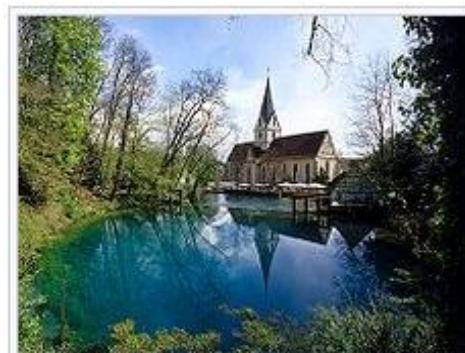
Quelltopf mit Kloster Blaubeuren

2. Tag: Wanderung mit einem Wanderführer vom Hotel aus über die Höhen Bad Urachs zum Gestütsgasthof Fohlenhof (Imbiss-Einkehr), anschl. zu den Gütersteiner Wasserfällen und nach Bad Urach zurück. Die Wanderstrecke ist 14 km mit einer Höhendifferenz von 300 m. (Auch Teilstrecke möglich!)